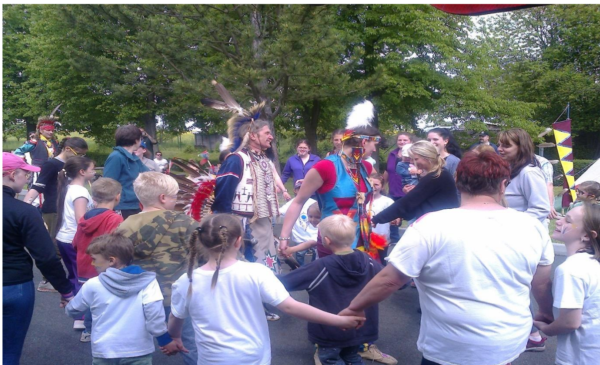
Akce pro děti pořádaná Dámským klubem (2019)

Žádoucí je, aby obec aktivity obou organizací i nadále podporovala. Činnost SDH je pro obec nenahraditelná. Obecní i mimoobecní aktivity Dámského klubu jsou v rámci regionu velmi kladně hodnoceny a pomáhají tak významným způsobem zlepšit povědomí o obci a zakládat zde nové tradice.