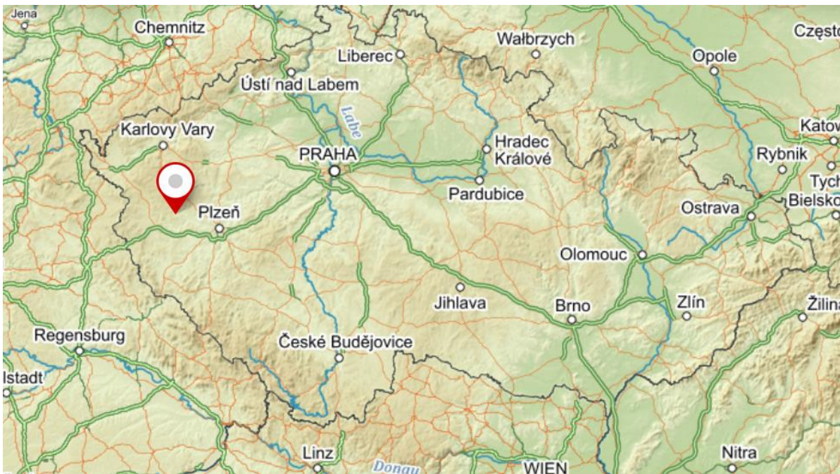
Obr. č. 1 Poloha obce v ČR

Obec Cebiv se nachází v západní části České republiky v Plzeňském kraji, v jihovýchodní části okresu Tachov.