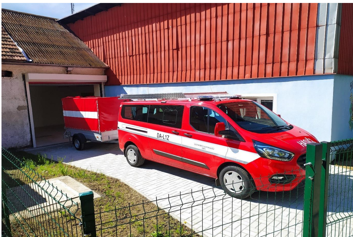
Nový požární automobil před opravenou zbrojnicí (2021)

SDH Cebiv - celkový počet členů sboru se dlouhodobě pohybuje kolem 25. Pro řešení mimořádných událostí byla ze členů sboru obcí zřízena zásahová jednotka kategorie JPO V, která má 11 členů. Důležitost jednotky pro obec a její obyvatele se projevila již několikrát, například při řešení následků přívalových dešťů, které se v posledních letech opakují stále častěji. Členové SDH se dále zapojují do organizování různých obecních akcí a pomáhají při různých hospodářských činnostech (práce v lese, svoz velkoobjemového odpadu apod.). SDH má pro spolkovou činnost k dispozici klubovnu, kterou si členové vlastními silami v součinnosti s obcí opravili. Jednotka SDH obce je od roku 2021 vybavena novým dopravním automobilem s přívěsem na hašení a dále základním vybavením v rozsahu stanoveném přílohou vyhlášky č. 247/2001 Sb., o organizaci a činnosti jednotek PO. Technika je umístěna ve zbrojnici, která byla zrekonstruována v roce 2021. Doposud nebyla provedena úprava šatny a skladu na umístění technických prostředků. Podpora obce pro činnost SDH Cebiv mj. spočívá v každoročním poskytování příspěvku ve výši 50 tis. Kč.