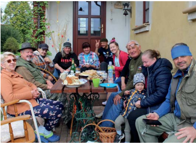
Velikonoce v Bezemíně